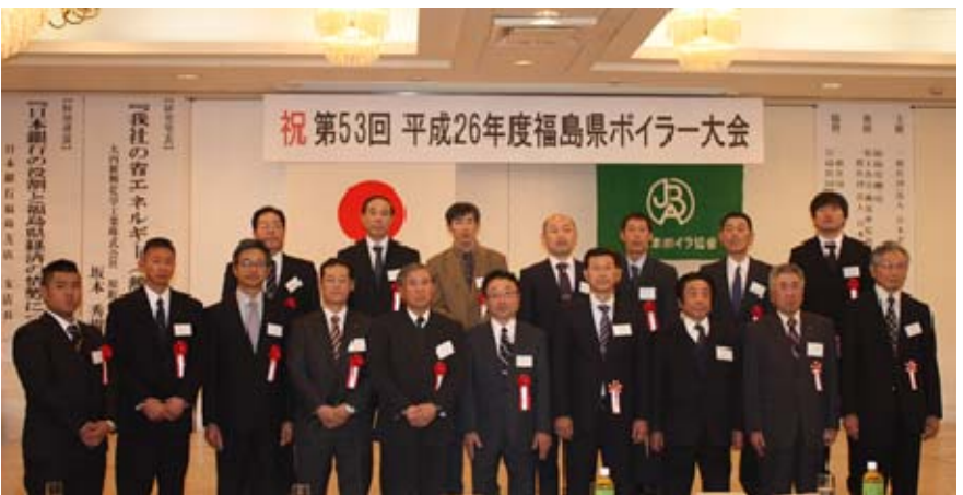
受賞者記念撮影 労働局長表彰 2名 日本ボイラ協会会長表彰披露 2名 支部長表彰 13名(団体含む)