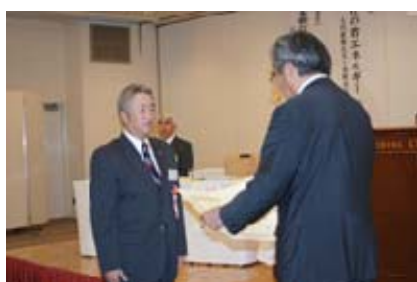
労働局長優良ボイラー技士賞