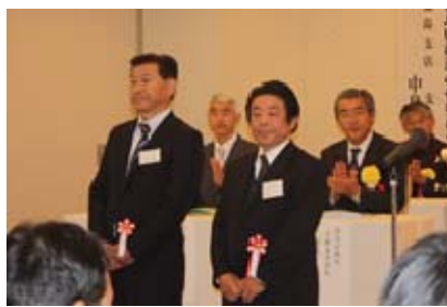
日本ボイラー協会会長優良ボイラー技士賞披露