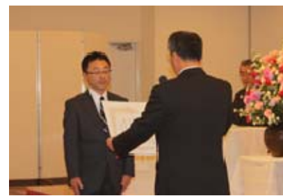
支部長ボイラー管理優良事業場賞