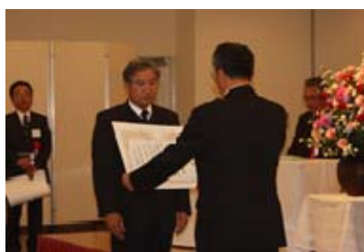
支部長ボイラー管理優良事業場賞