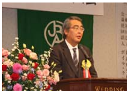
来賓代表挨拶 菊池泰文様：福島労働局労働基準部長