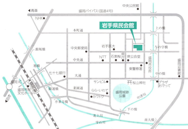
◎岩手県民会館案内図